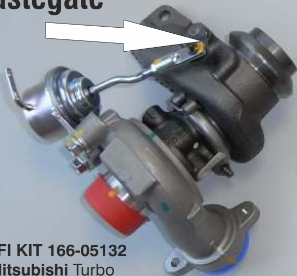
PROFI KIT 166-05132 mit Mitsubishi Turbo